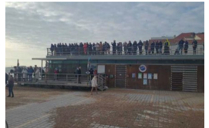
La foule se presse sur la terrasse du club de surf

Les grandes marées de mars, avec des coefficients allant jusqu'à 116 lundi 11 et mardi 12 mars, auront une nouvelle fois attiré la foule à Saint-Gilles-Croix-de-Vie, même si certains ont pris quelques risques.