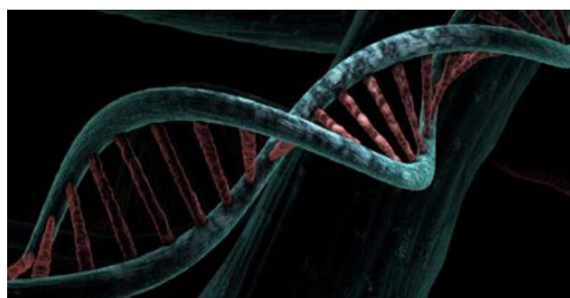
L'acide désoxyribonucléique (ADN) est une macromolécule biologique présente dans presque toutes les cellules.

Dans le cadre de l'étude de la complexité dans l'univers, cette première conférence, vendredi 15 mars, se concentre sur l'apparition de la vie sur Terre, en particulier l'émergence de la vie au niveau physique (avec le rôle clef du carbone et de l'eau),